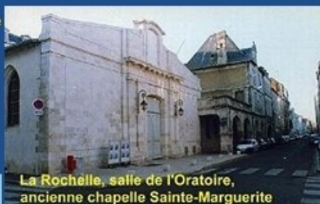
La Rochelle, salle de l'Oratoire, ancienne chapelle Sainte-Marguerite